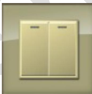
钢化玻璃宾香金色